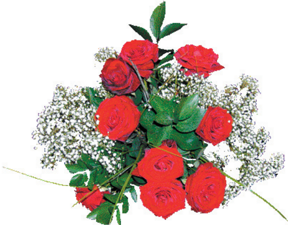
Mittblumen werden mit hochgiftigen Pestiziden gespritzt senernte ist überwiegend Frauenarbeit