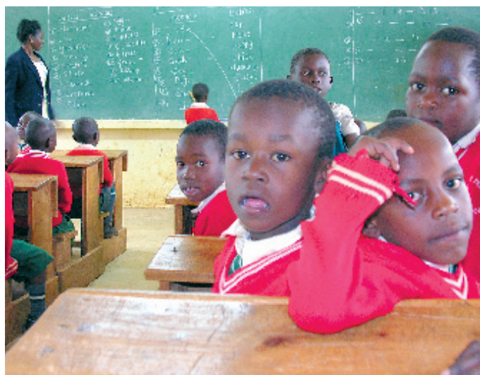
Fair Trade, Corbis (2)

Die Frauen arbeiten bis zu zwölf Stunden am Tag, gebückt, in der Hocke, auf den Knien, ständig in Kontakt mit Chemikalien. Die meisten müssen ohne Schutzkleidung wie Atemmaske, Kittel oder Handschuhe arbeiten. Sie kommen in ihrer Arbeitskleidung nach Hause, nehmen die Kleinkinder auf den Arm, bereiten das Essen. Die Frauen klagen über Brechreiz, Allergien, Sehstörungen